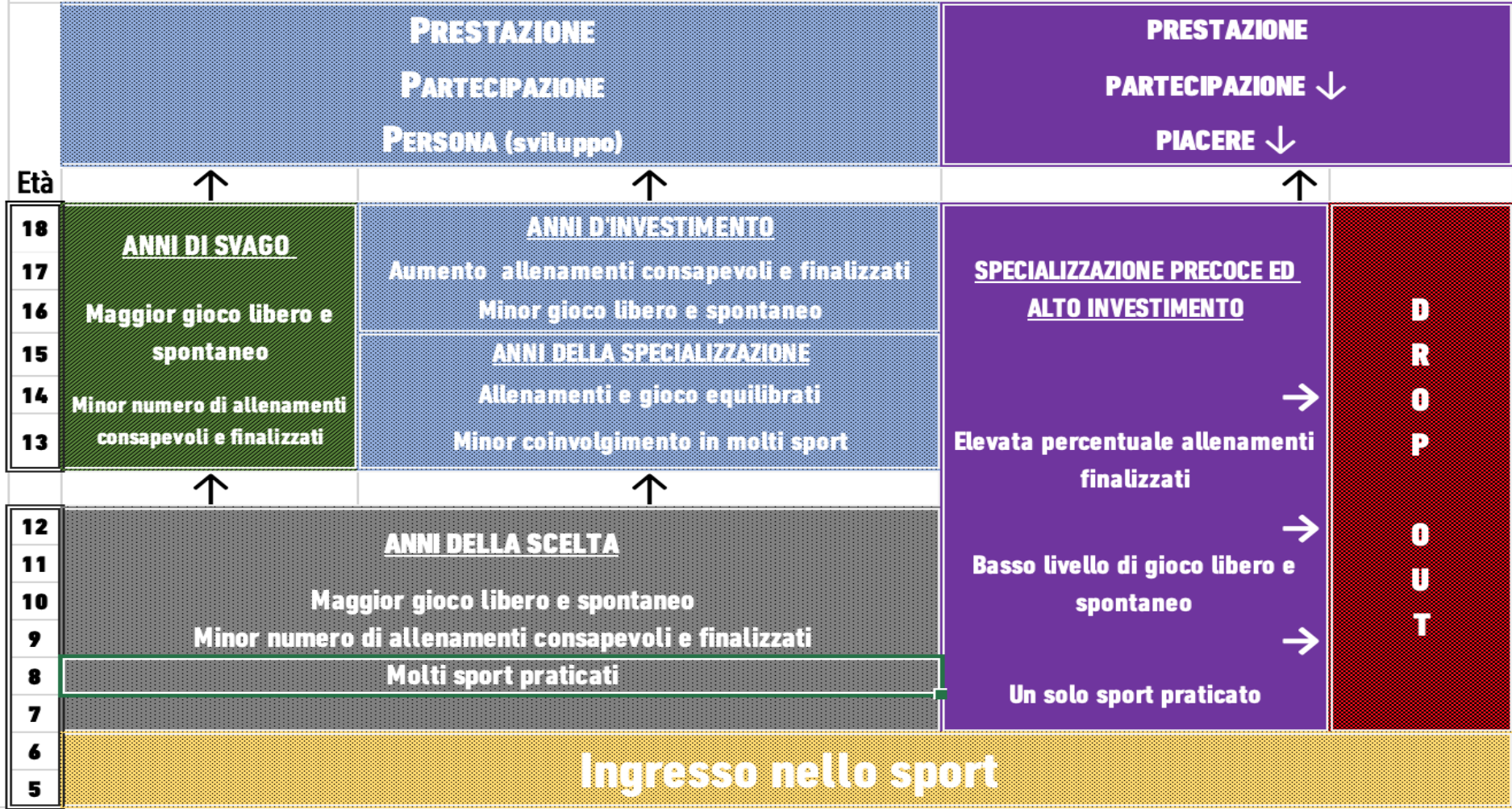
Modello delle tre "P" - Cotè & Fraser Thomas 2007